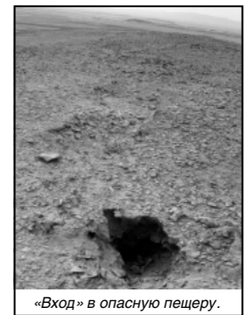
«Вход» в опасную пещеру.

Но палеоуфологи доверяют древним записям о «небесных посланцах» больше, чем современным сообщениям о «таких же» визитах - древние писцы фиксировали то, что видели.