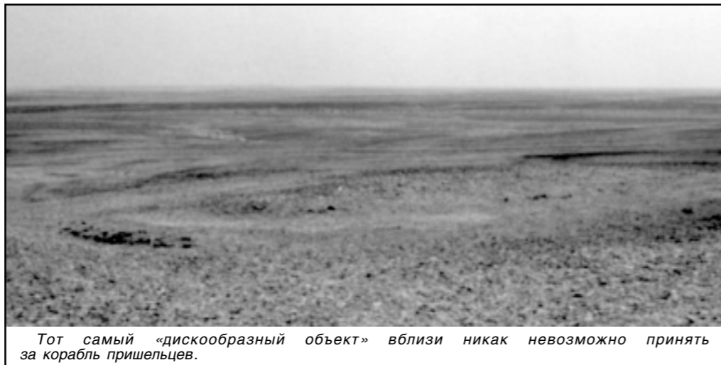
Тот самый «дискообразный объект» вблизи никак невозможно принять за корабль пришельцев.

ланием пускать в приграничный район «с непонятными целями» американских и израильских граждан. А других?