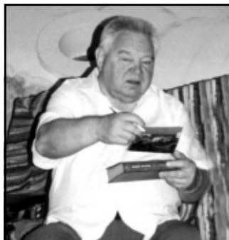
Летчик-космонавт, дважды Герой Советского Союза, доктор технических наук, Г.М. Гречко с 1994 г. участвует в работе объединения «Космопоиск».

Лишь спустя десятилетие Ситчин опубликовал снимки и описание. По его следам готовы немедленно ринуться десятки исследователей. Однако египетские власти не горят же-