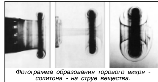
Фотограмма образования торового вихря - солитона - на струе вещества.

были открыты ячейки в мировом океане. О ячеистой структуре межпланетного космоса писал Скребушевский. В частной беседе я узнал от Г.М. Гречко, что он установил ячеистую структуру ат-